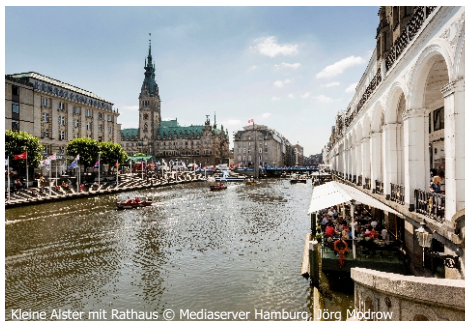
Kleine Alster mit Rathaus

Der heutige Ausflug führt in die Hafen- und Hansestadt Hamburg . Bei einer Rundfahrt erkunden Sie die bekanntesten und schönsten Ecken der Stadt. Hier befindet sich nicht nur der größte Seehafen Deutschlands sondern hier gibt es auch mehr Brücken als in Venedig. Spüren Sie den hanseatischen Charme. Am Nachmittag können Sie die Stadt individuell erkunden. Im sogenannten Schanzenviertel laden zahlreiche Cafés, Restaurants und Läden in charmanten Altbauten zum Flanieren und Verweilen ein. Shoppingfans kommen in der Mönckebergstraße auf ihre Kosten. Oder Sie besuchen das berühmte Miniatur Wunderland (fak.). Um Wartezeiten zu umgehen empfiehlt es sich, das Ticket im Voraus zu buchen. Musical-Liebhaber haben die Möglichkeit eine Nachmittagsvorstellung von „König der Löwen“ oder dem neusten Stück aus dem Hause Disney „Hercules“ zu besuchen.